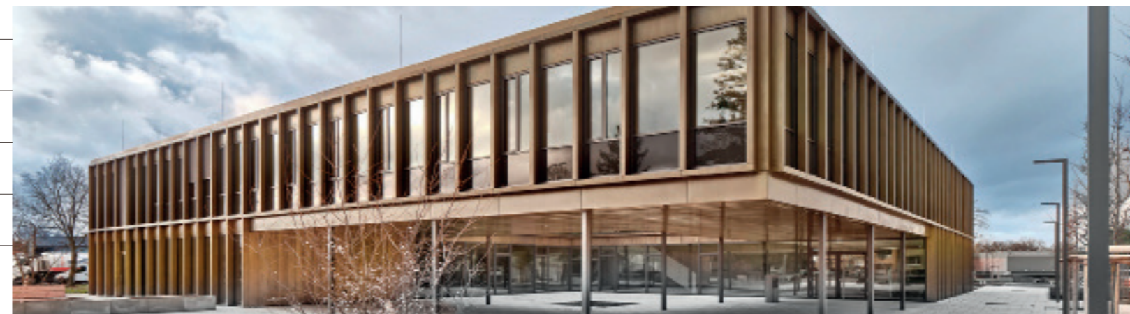
Deutscher Holzbaupreis 2023: Rathaus in Hainburg