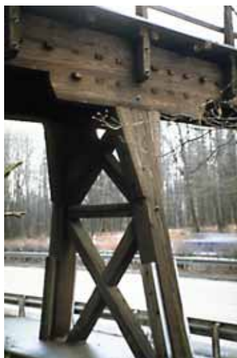
Bild 2 Ehem. Fußgängerbrücke über die BAB 8 bei Pforzheim-West

Holz hat bei richtiger Behandlung (insbesondere konstruktiver Holzschutz) eine hohe Lebensdauer; mehr als 200 Jahre alte Holz-