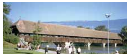
Bild 3c Ehem. Straßenbrücke Wangen (1550)

brücken – vor allem in den Alpenländern – beweisen dies [6]; vgl. auch Bild 3 . Die Philosophien der neuen DIN 1052 und DIN 1074 unterstützen nachhaltig die Planung der Dauerhaftigkeit von Konstruktionen des Ingenieurholzbau.